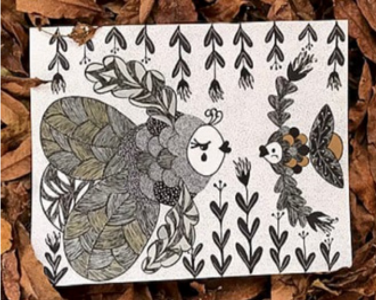
Ilustración de Céu do Tulipia

“He crecido, fui esas dos peces. Ya no quiero regresar a ser pequeña. Me siento orgullosa de donde estoy. No quiero volver a permitir que me digan que estoy mal”.