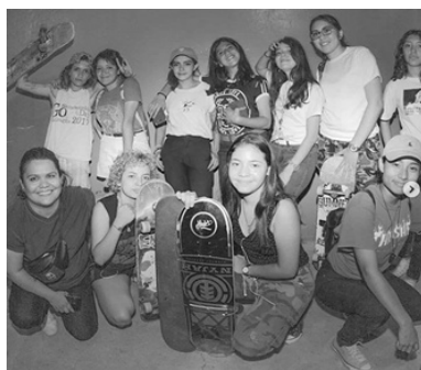
Las Skatas, Nicaragua